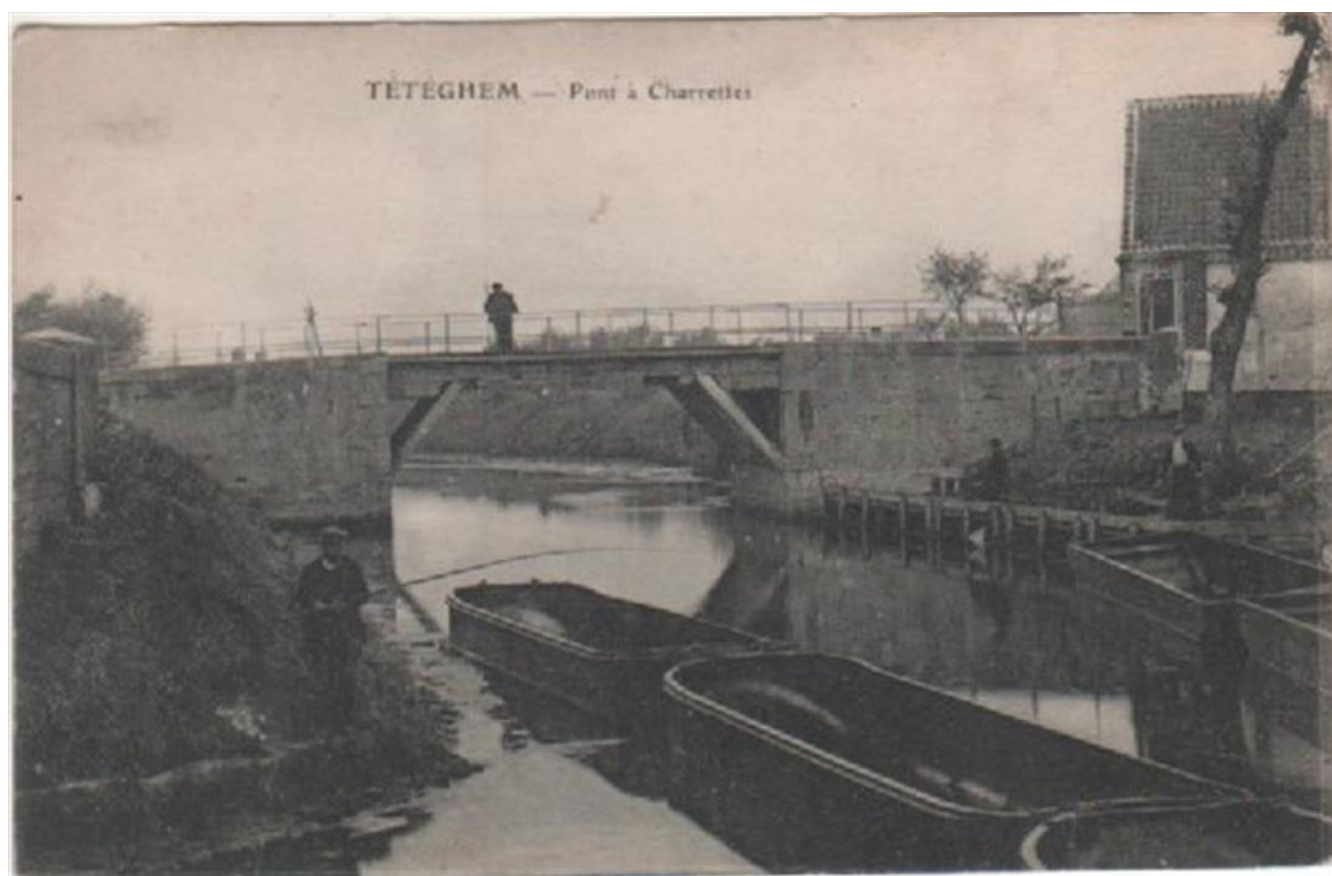
Pont à Charrettes

« brigade ambulante de Dunkerque opèr(e) fréquemment sur la frontière de Tétéghem » (4)